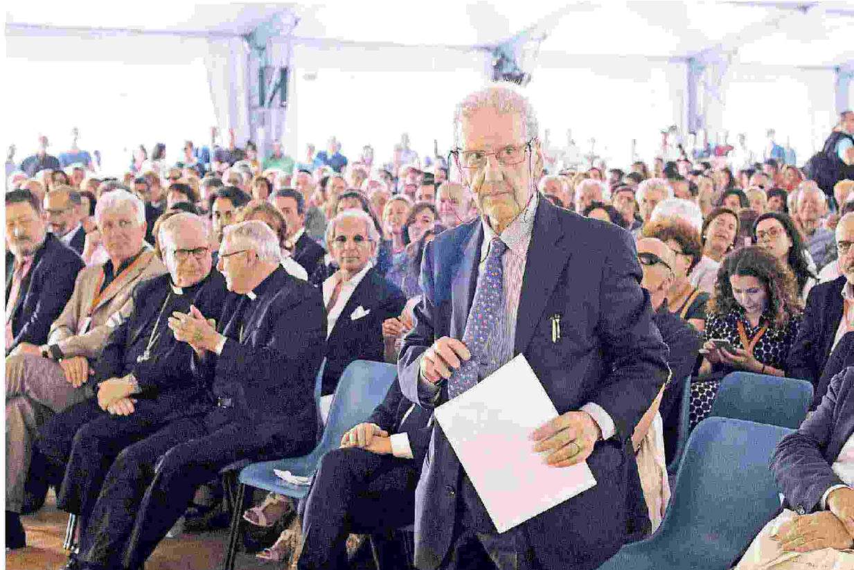
Il professor Salvatore Settis, sullo sfondo la platea gremita