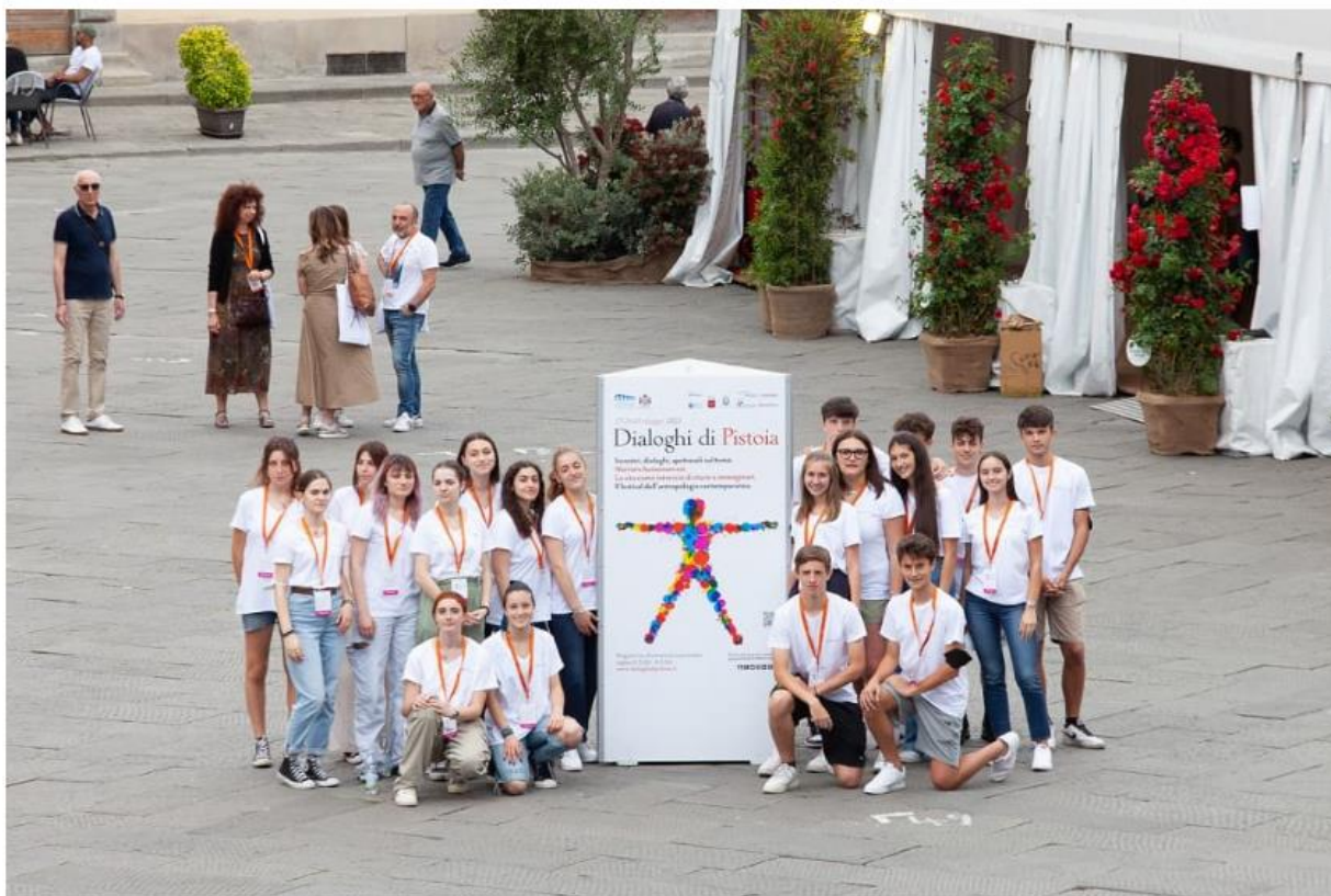
Volontari della scorsa edizione dei Dialoghi

Come sempre, i Dialoghi chiamano studiosi e intellettuali di diversa estrazione e discipline a confrontarsi su un tema chiave della contemporaneità, che è parte centrale di una nuova visione di un futuro sostenibile che permetta di rispondere alle crisi in atto, in primis quella climatica.