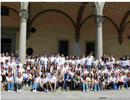
Volontari Dialoghi di Pistoia 2023

A questi si aggiungono quest'anno anche tre scuole superiori fuori Provincia: 5 studenti dal Convitto Nazionale Cicognini di Prato, 1 dal Liceo Classico Galileo di Firenze e 1 dal Liceo Scientifico Vallisneri di Lucca.