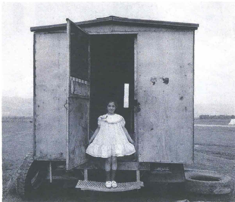
"Turkey - Central Anatolia" di Nikos Economopoulos, 1988 ©Magnum Photos. In alto l'autoritratto di Ferdinando Scianna

Da oggi a domenica Pistoia va in scena "Dialoghi sull'uomo" , festival di antropologia del contemporaneo ( www.dialoghisulluomo.it ). Incontri, dialoghi, letture, spettacoli, proiezioni e passeggiate. Il tema di quest'anno è «Le case dell'uomo. Abitare il mondo». Tra i partecipanti l'antropologo Francesco Remotti, il calciatore Lilian Thuram, Ferdinando Scianna, Vinicio Capossela.