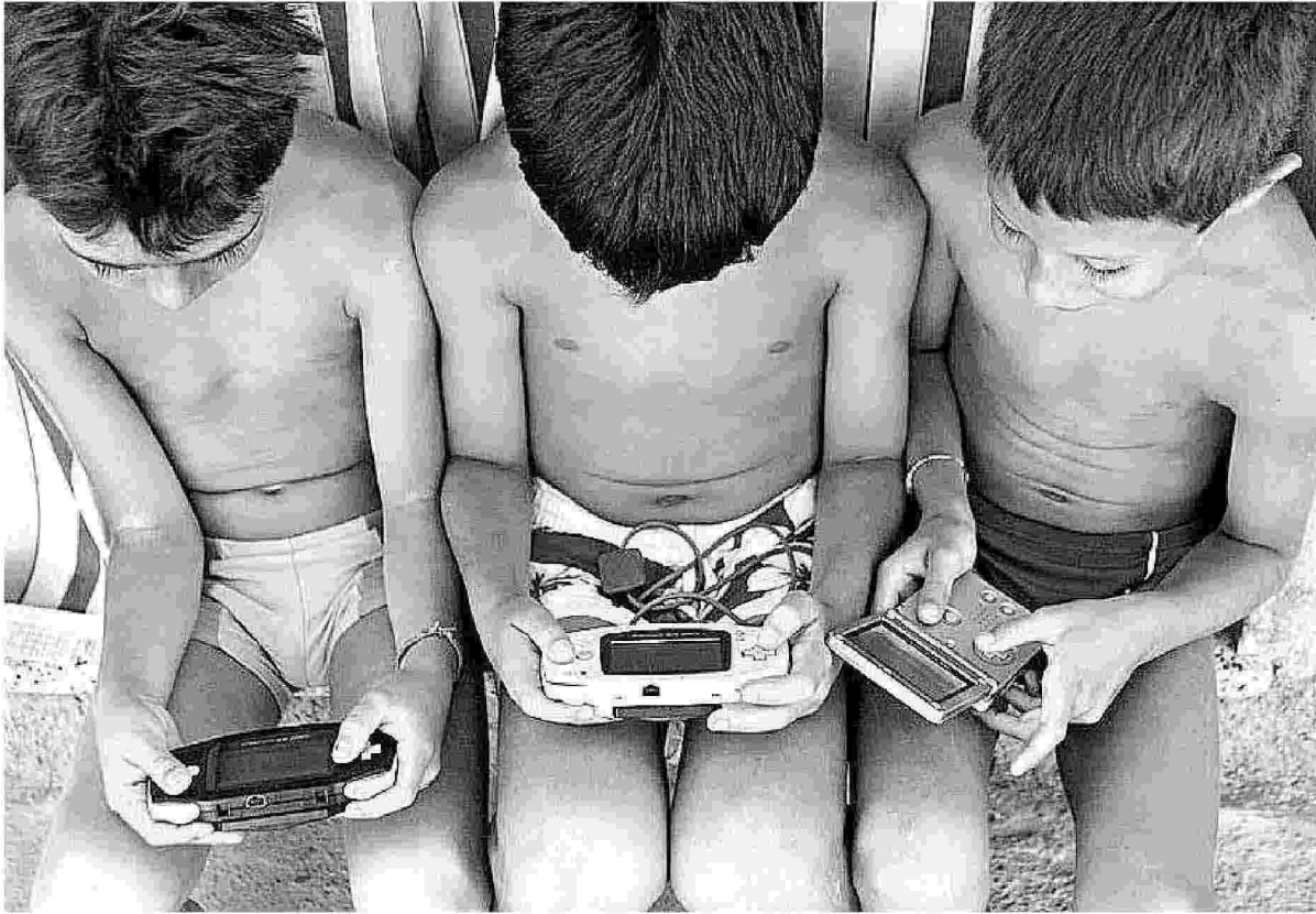
Qui e a destra due delle 50 foto esposte a Pistoia per la mostra "In gioco"