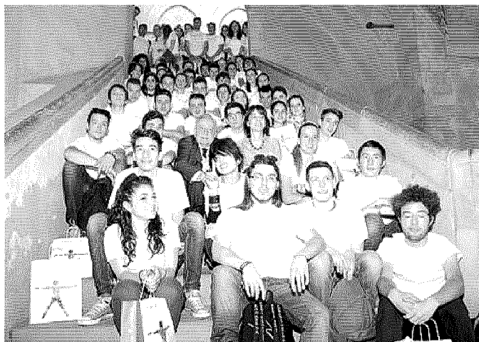
Gli studenti-volontari insieme al presidente della Fondazione Caripit Paci