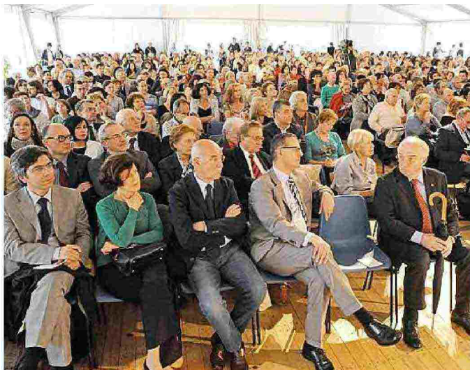
Uno degli incontri di una precedente edizione di Dialoghi sull'uomo (Gori)

Con il biglietto dei Dialoghi sarà possibile accedere gratuitamente ai principali musei della città: Museo Civico; Centro di documentazione Giovanni Michelucci; Palazzo Fabroni Arti Visive Contemporanee; Museo Marino Marini; Museo del Ricamo; Casa - studio Fernando Melani. Inoltre ingresso gratuito anche alla mostra 25.8.1964 C'era Togliatti. Fotografie di Mario Carnicelli (Palazzo Fabroni, via Sant'Andrea, 18).