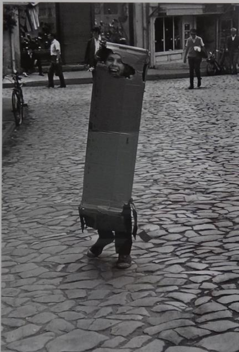
Skopje, Repubblica di Macedonia, 1969