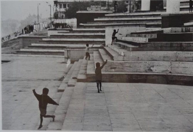
Benares, India, 1997